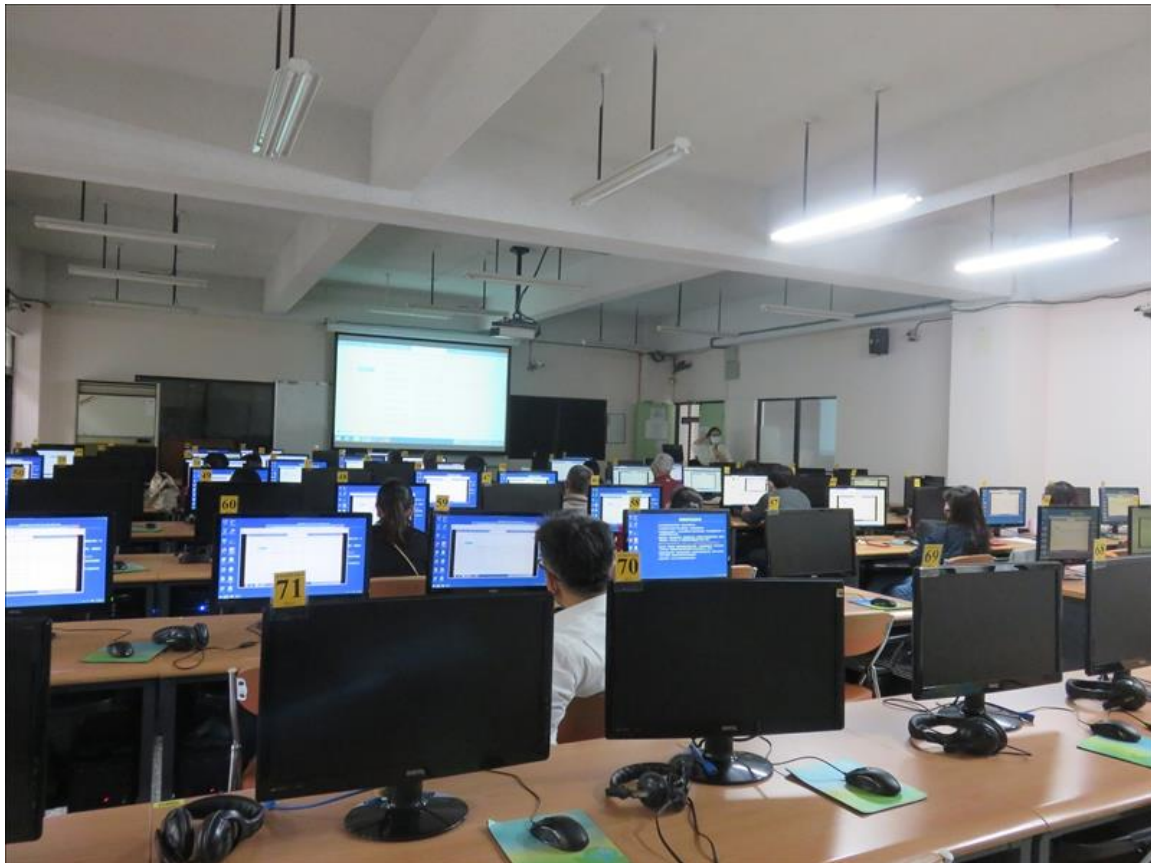
(101)iClass 學習平台導入工作坊(0323-2)