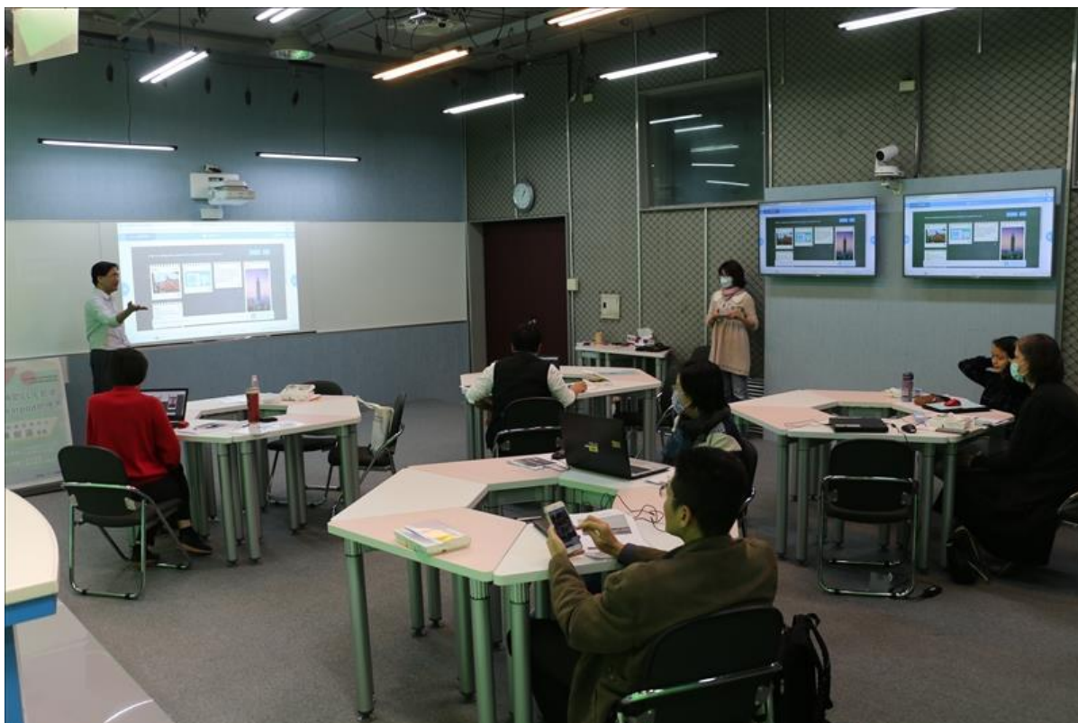
與會老師藉由照片的方式回覆問題，跳脫文字框架