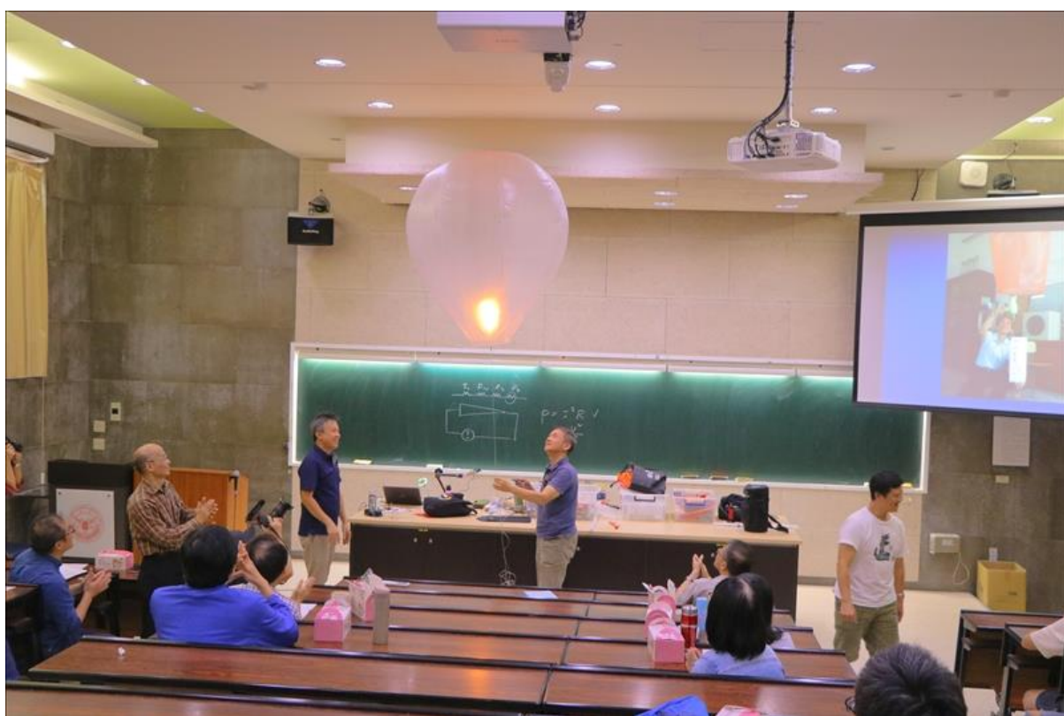
利用自製天燈講解物理現象