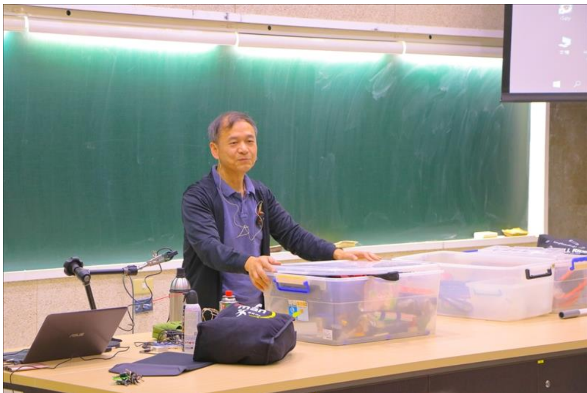
陳老師準備了各式各樣的道具