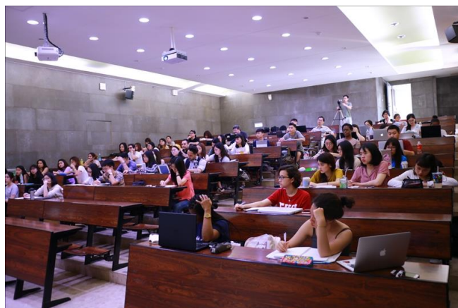
課堂上學生們專心聽講