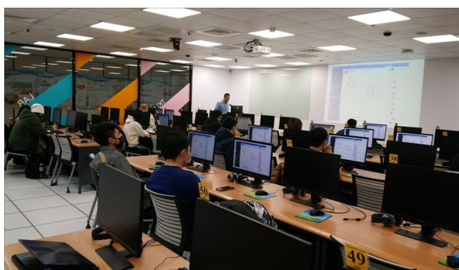
23 位 淡江微軟校園學生大使，在 B206 認真上課。