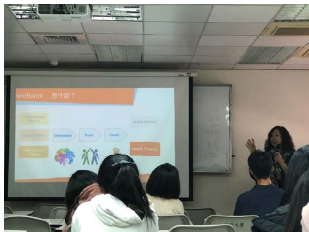
介紹泥巴娛樂優勢