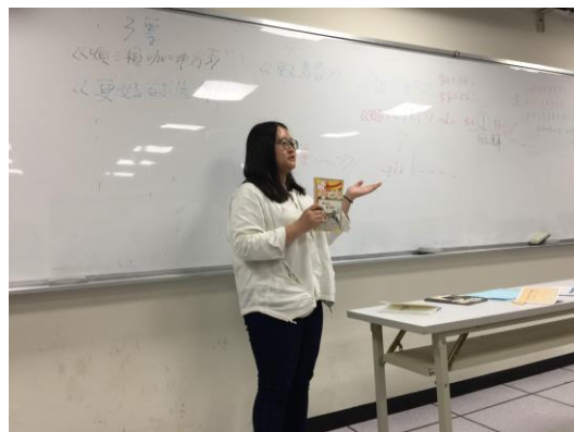
學生講解創作的故事(1)