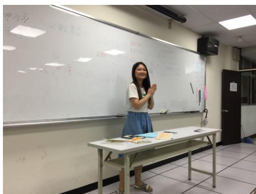
學生講解創作的故事(2)