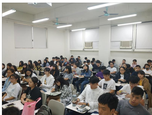
學生思考與運用手機攝影來進行圖文表達