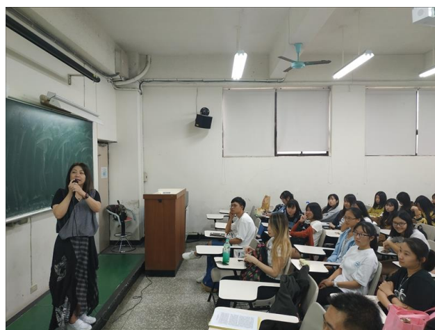
講者以彎彎、馬克、馬來膜等圖文創作者為例 詳加說明