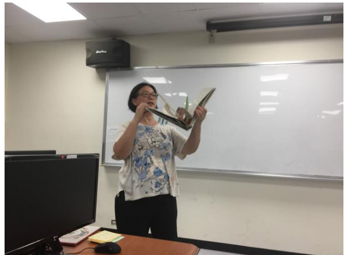
講者講解立體繪本(2)