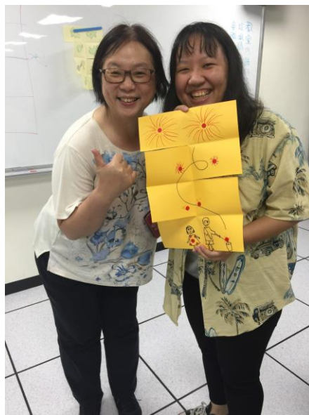
學生拿起作品與老師合影