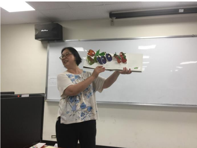
講者講解立體繪本(1)

第二本手工書，讓同學享用不同的表現手法，去體驗收集印章的樂趣，同學們彷彿回到孩童時間的歡樂！