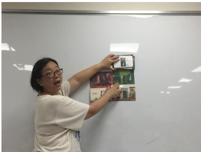
講者講解立體繪本(3)