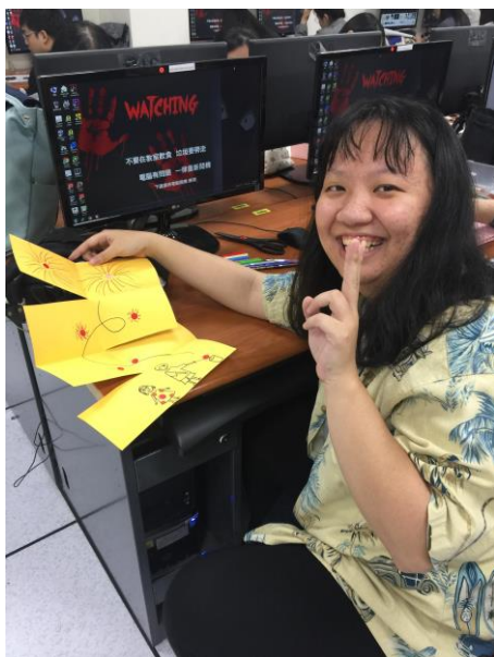
學生講解創作的故事