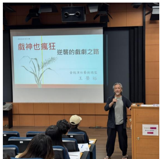
講師分享自身生平（二）