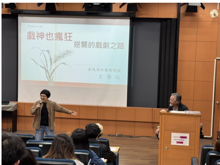
老師介紹講師背景（一）

2010 年《大國民進行曲》，探討殖民時代台灣人國家、身分認同（台灣、日本）的問題。2021 年《雨中戲臺》獲得第 32 屆傳藝金曲獎、最佳演員、最佳新秀獎。2024 年 8 月上演《西來庵》，屬於台灣奇情武俠演義，背景是發生在 1915 年，台灣最後一次漢人武裝起義，對抗日本的故事。