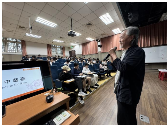
講師分享雨中戲臺（四）