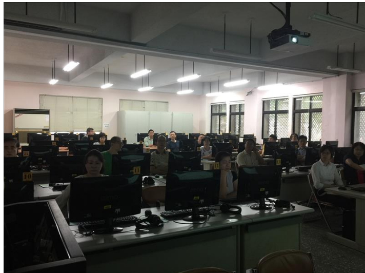
iClass 學習平台成績管理工作坊(0611-1)

本次課程以畢業班授課老師為主，介紹 iClass 成績介接功能，能讓教師了解畢業班成績上傳之操作。