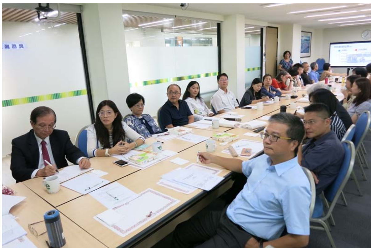
本院參與教師認真聽講