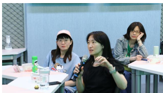
與會老師熱烈參與研習交流與回饋