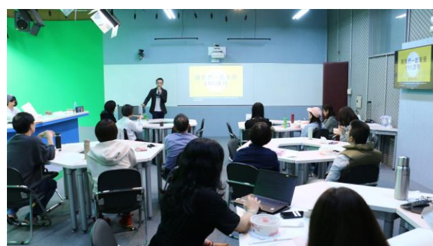
與會老師專注參與研習活動