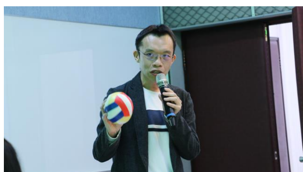
孫 老師分享如何增進課堂教學互動的技巧