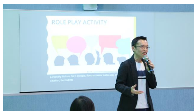
孫 老師分享如何將設計思考融入於教學當中