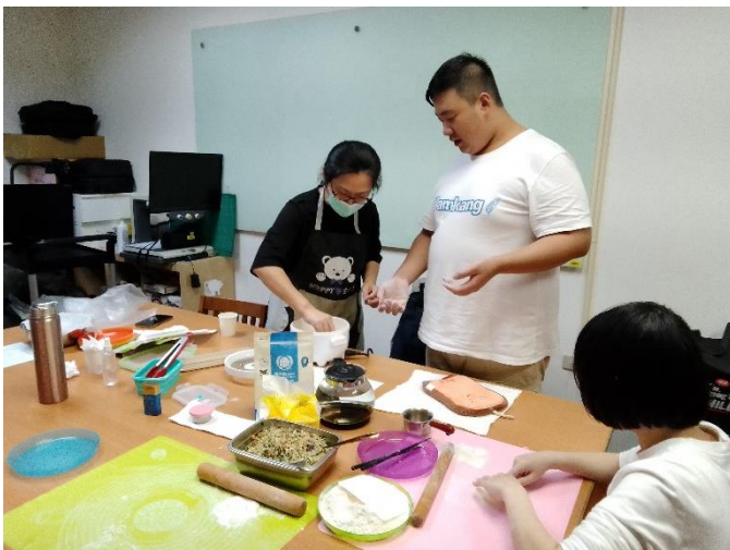
學員體驗與訓練手眼協能力