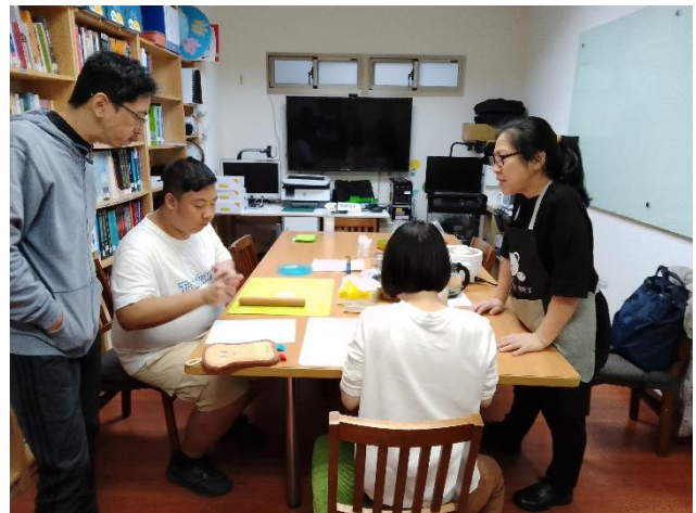
個案學員進行活動先前評估