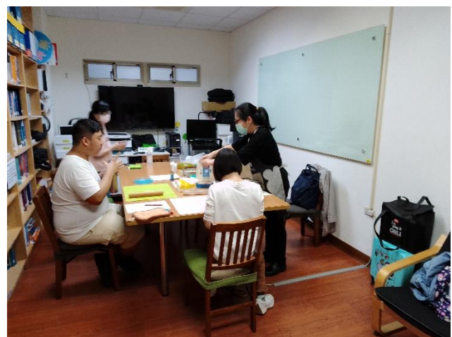
講師示範輕食製作步驟