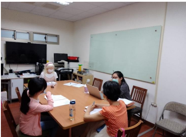
期末職涯諮商老師與輔導老師討論轉介個案