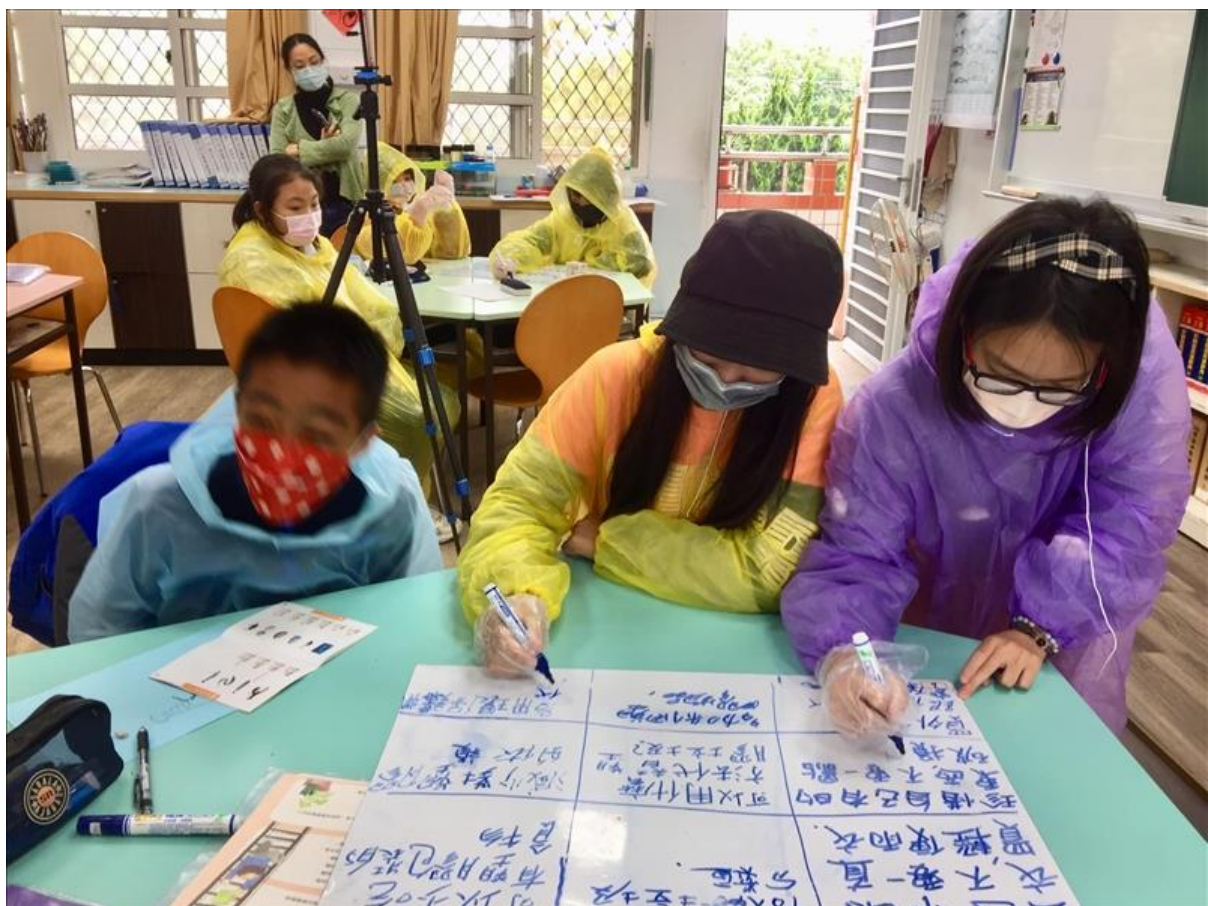
學生撰寫分組學習單