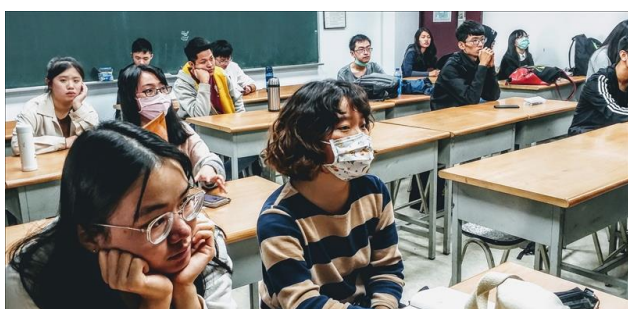
主講人與學生互動