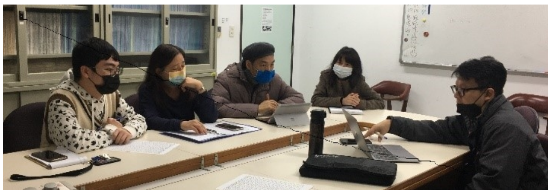
戴昀老師後來也加入討論