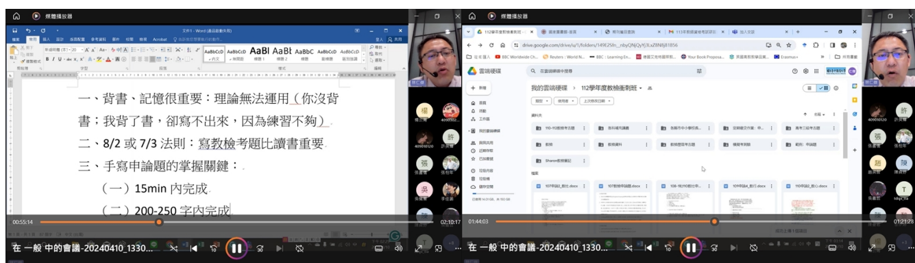
老師提出考前準備的關鍵策略

老師首先提出教師資格考試的準備策略，第一，多讀多記，才能寫出非選題的內容；第二，採用 8/2 或 7/3 法則，寫考題比讀書重要，第三，手寫申論題需掌握的關鍵，例如，每題在 15 分鐘之內完成以及寫 200-250 字等。接著，老師展示網路上「教師資格考試衝刺班」的參考檔案與資料，然後針對非選題提出回答策略，包括針對題目配分回答，以一項回答 2 分為原則，以及按題號與小題依序排列回應。最後，老師針對特定試題提供相關的文章內容，讓學生參考與閱讀。