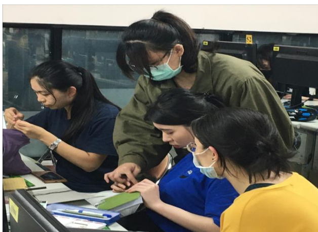
學生製作手工書的討論過程