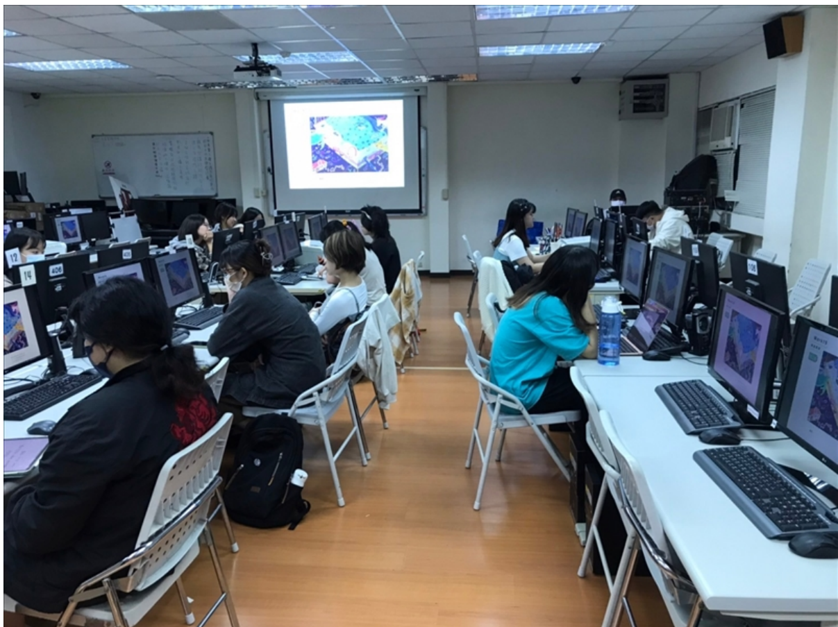
講師介紹自身經驗和作品

最後再跟大家分享角色 IP 和社群經營的心得，並介紹角色設計不只是畫出一個角色，更需要更多背景及個性設定，才能使角色更加完整、給人的感覺更生動、更貼近生活，並且在初期不要害怕改變或是對自己的作品不滿意，因為長時間的練習和經營作品，一定能夠讓自己慢慢抓到自己喜歡的風格和作品的呈現方式，講者以自身的經歷去鼓勵同學們勇敢嘗試跟創作，讓大家都被激勵士氣，躍躍欲試，最後講者也將他自己製作的角色 IP 周邊帶到現場，讓大家實際看到角色 IP 的應用層面真的是相當廣泛。