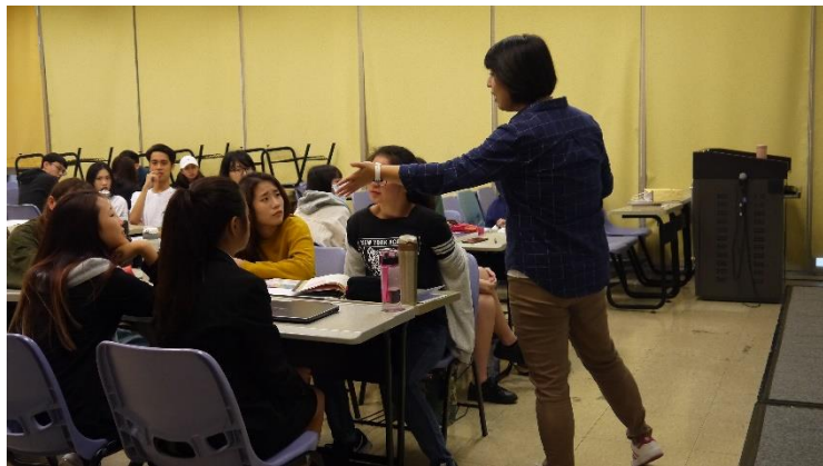
紀老師互動式教學，關注學生不同觀點