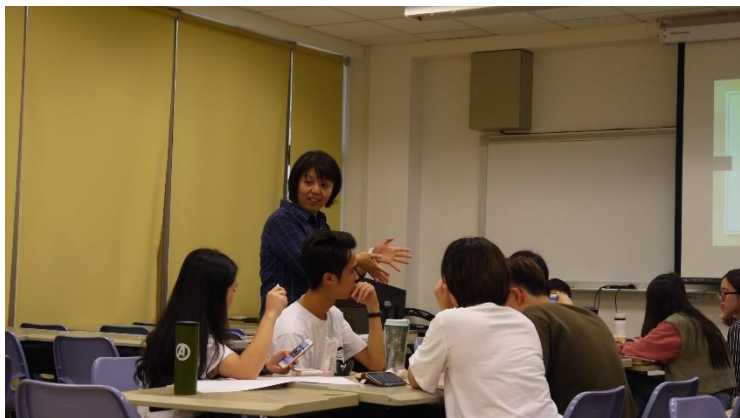
進入到小組的討論，協助解惑、引導思考方向