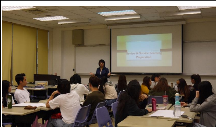
課程開始紀老師以提問開頭引導學生思考