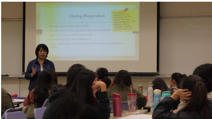
原理概念解釋與說明