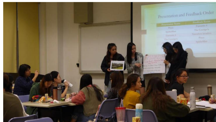
小組發表成果展現，老師、同學給予回饋