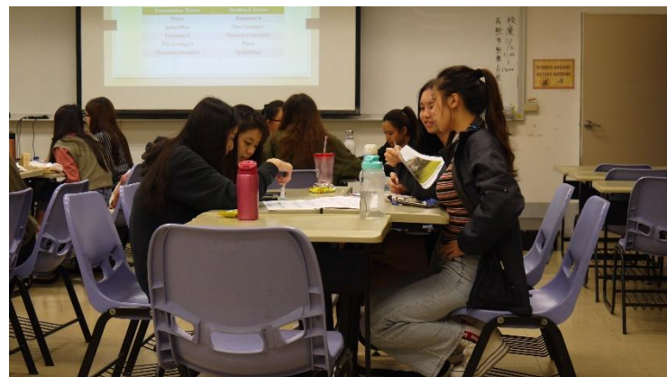
小組進行活動討論與構思呈現方式