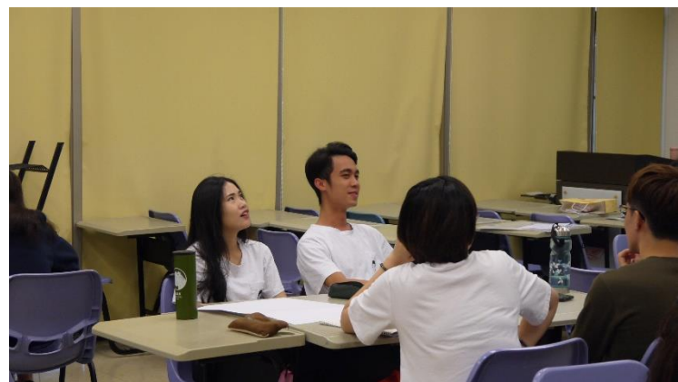
師生討論，小組學生思考並回應老師與全班