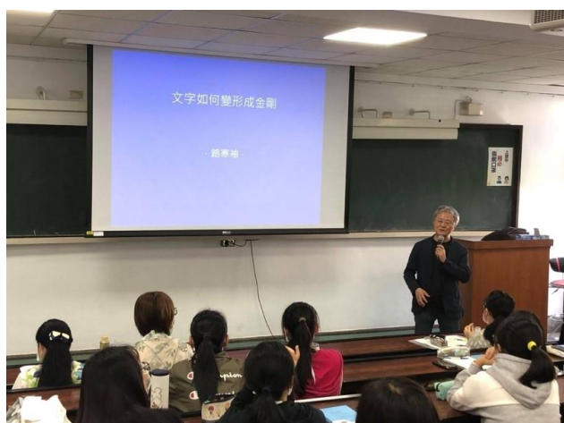
路寒袖先生自我介紹 (本名王志誠，前台中市文化局長)

邀請著名詩人路寒袖專題演講，曾擔任高雄市文化局長，台中市文化局長的路寒袖從文化創意的定義與內涵談起，文化是人類生活智慧的累積與結晶；創意是沒有變有，有變不一樣；而任何產業都可以是文化創意產業，重要的是行銷的工作。講者也以自己曾經參與的文創工作為例，談詩與歌在文創商品上的應用並指導同學新詩與歌詞的寫作。土地不僅承載著人，也搬演著人的故事，同一塊土地，卻可以演繹不同世代的人的故事。在地景地貌變動劇烈的現代，我們的生命故事是否因為舞台場景的異質化而消逝？路寒袖在這堂演講中挖掘的，是還能感動我們的共同身影吧。