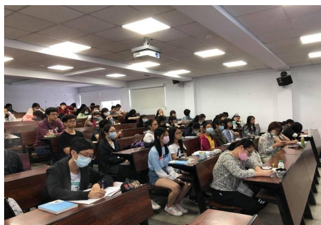
學生於課堂講座上聆聽講師所帶來內容