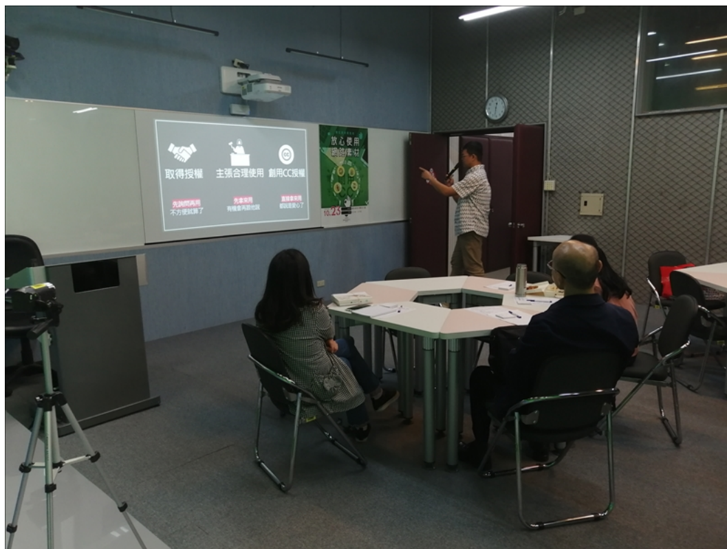
講師以借傘為喻生動說明三種合理使用網路素材的情境

最後，除了研習會的內容，講師也就預先向教師們收集、整理的疑問，在研習會中個別舉例、針對回應。良好的互動、趣味性的講解，以淺顯易懂的方式幫助教師們建立正確觀念，掌握正確引用網路素材的方式，讓教材製作安心又踏實。