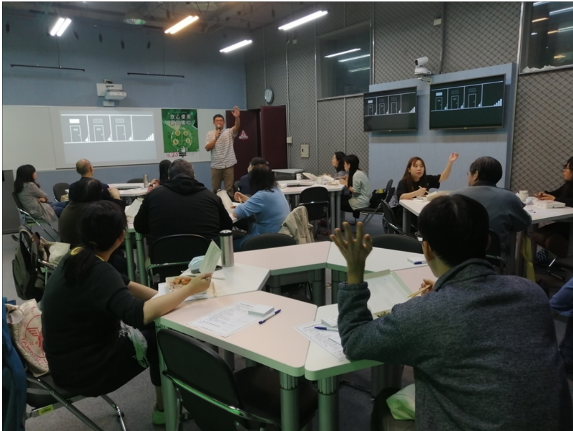
講師與教師有良好互動