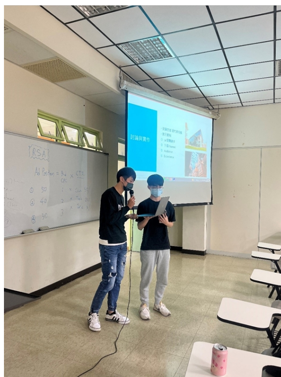
【資傳系專題演講】數位行銷