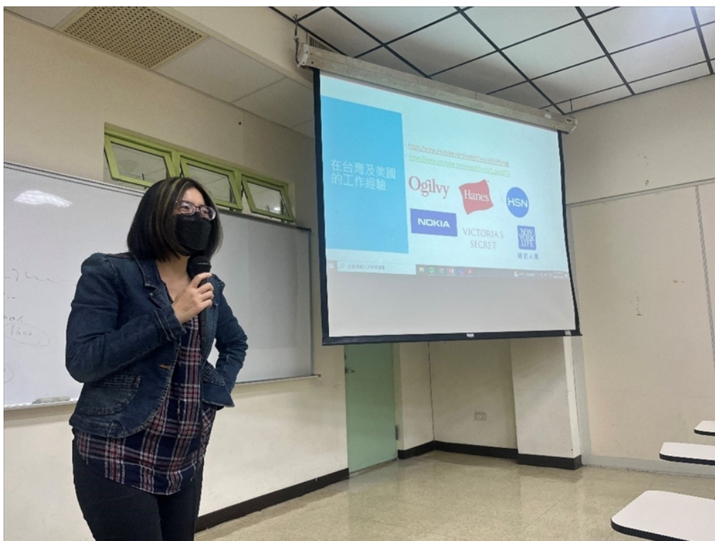
【資傳系專題演講】數位行銷