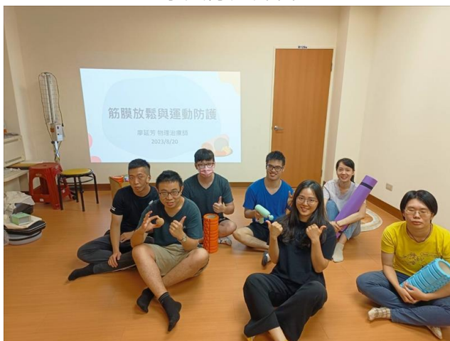
講師帶領學員筋膜放鬆與防護運動傷害