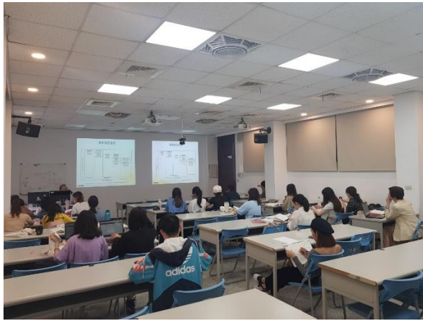
講述專案管理知識 02