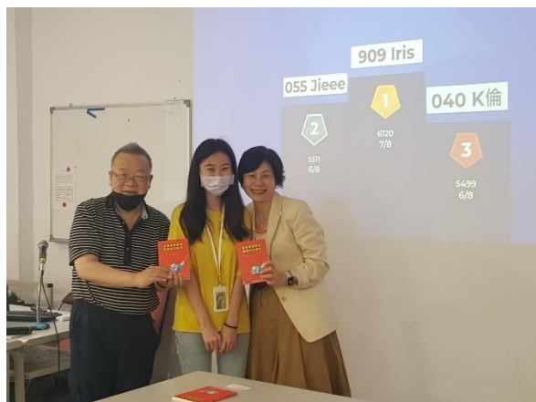
有獎徵答活動頒獎