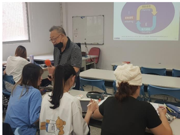
下台解決學生問題