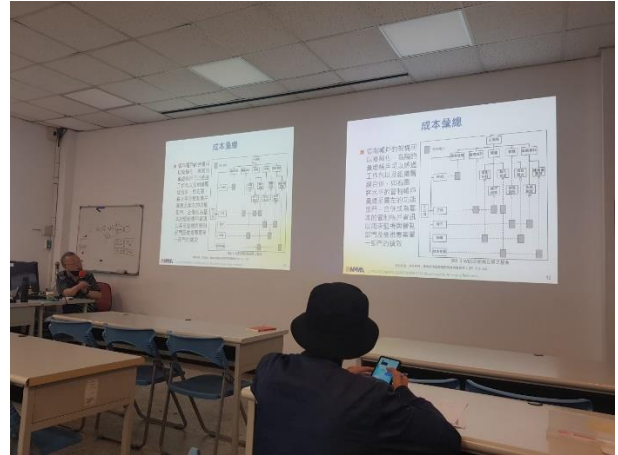
講述專案管理知識 03