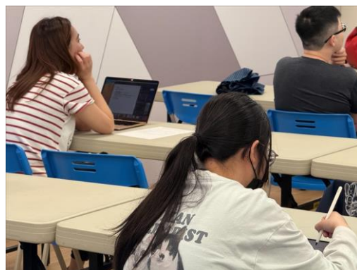
學生一邊使用電腦或平板筆記課程要點，展現高投入程度。