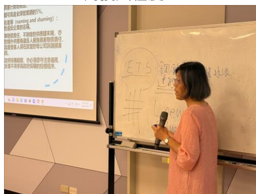
白板記錄「ETS」、「通報義務」等關鍵詞，協助學生理解法規邏輯。