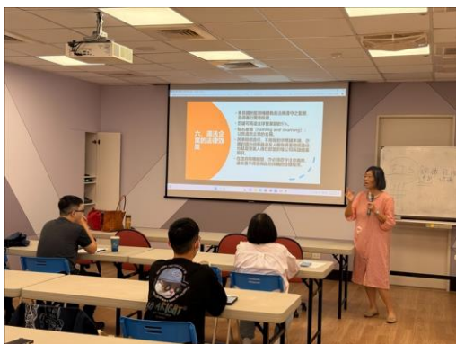
講師強調企業若違反 ESG 規範，將面臨法律與聲譽風險，現場氣氛凝重而專注。

經滿意度問卷調查，共有 6 人填寫，其中對本次活動非常滿意的平均分數為 5.83 分；對課程主題內容切合期望的平均分數為 5.67 分；對講師的安排感到滿意的平均分數為 6 分；對課程場地與設施合宜的平均分數為 5.67 分；未來類似的課程會想主動參與的平均分數為 6 分(各項分數總分皆為 6 分)。