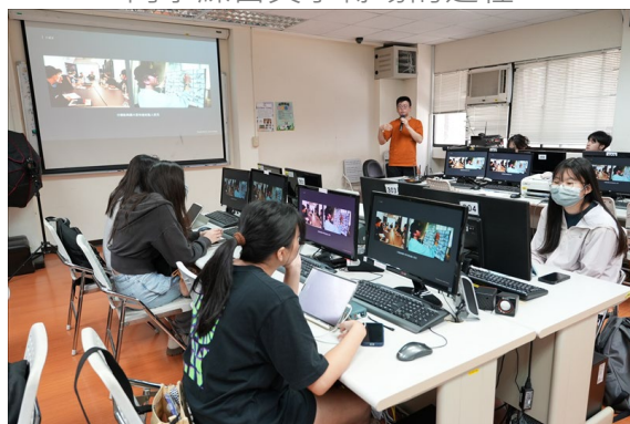
業師介紹製作動畫中的分鏡