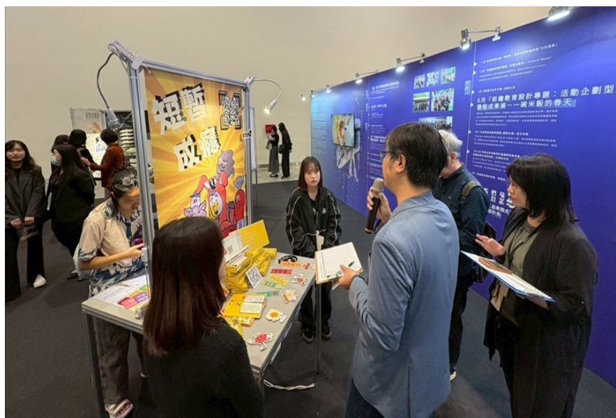
邀請校外專家評圖