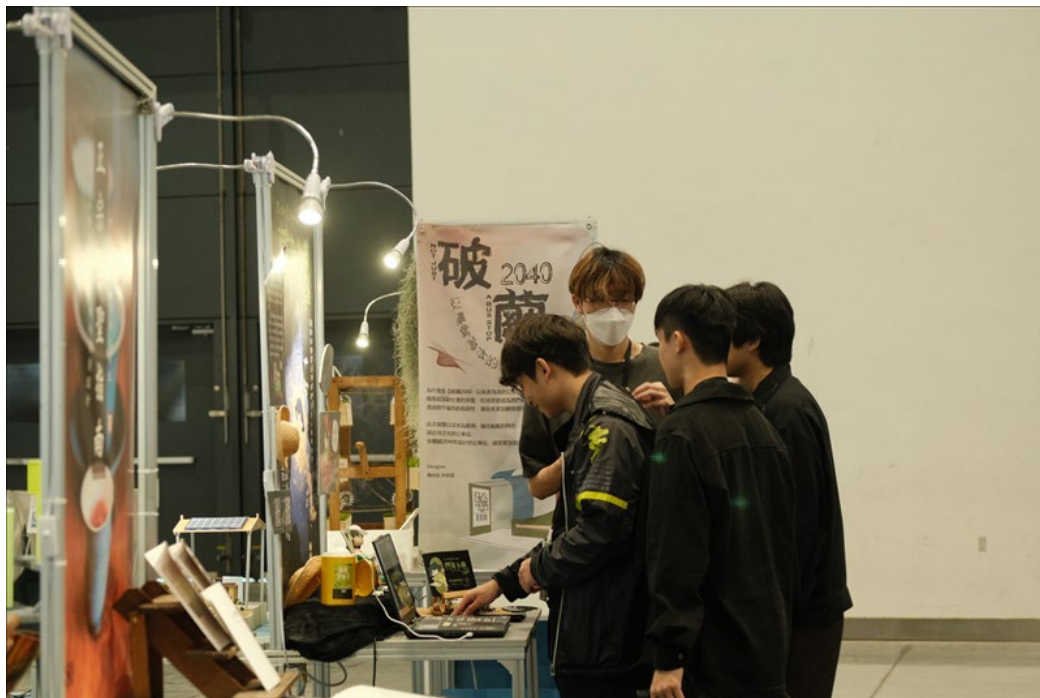
學生與觀展人互相交流想法意見