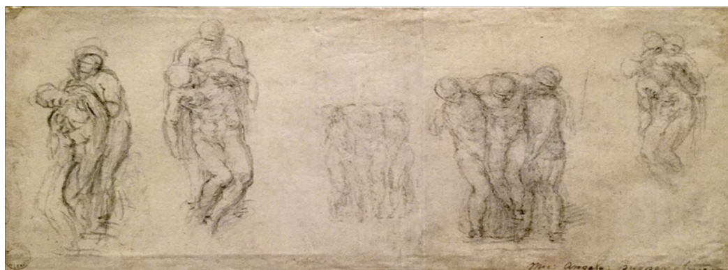
米開朗基羅的經典素描