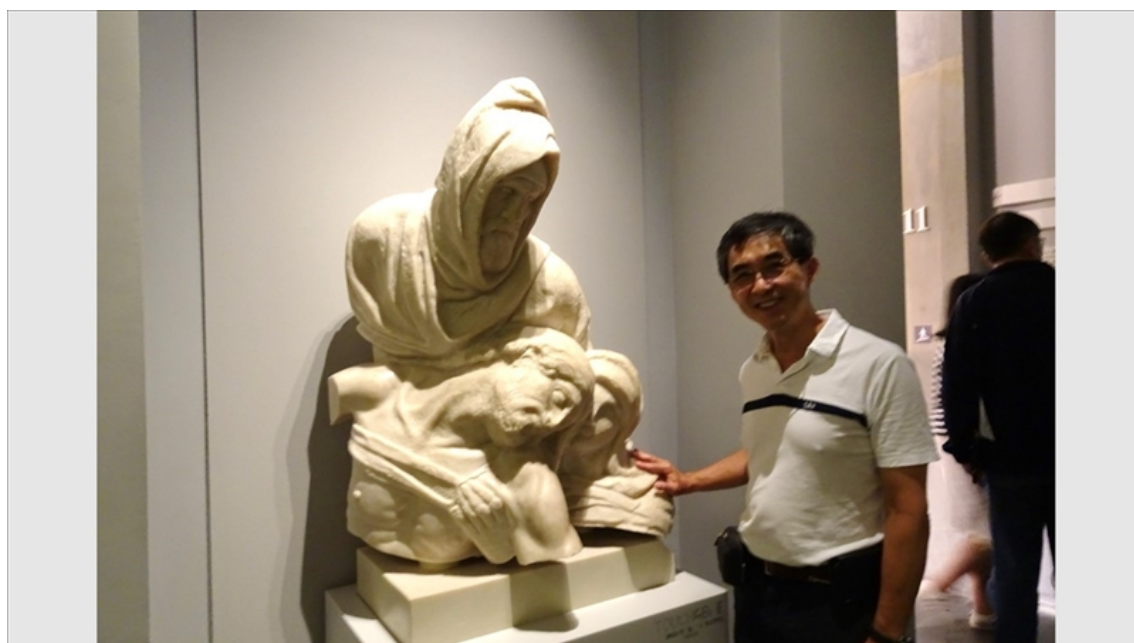
講者看展經驗分享