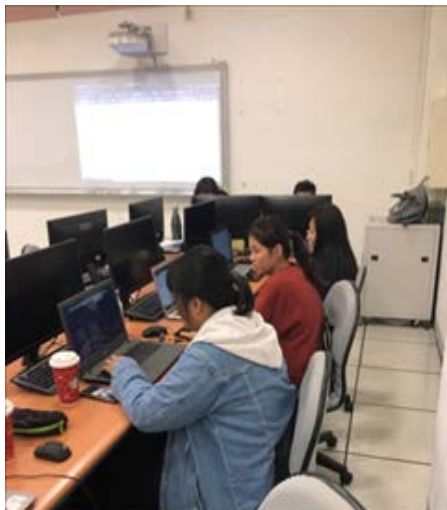
同學們在課堂上討論

同學經過這堂課後，已經能夠自己用 Flask 架設伺服器，將自己設計好的網頁架設到伺服器上。