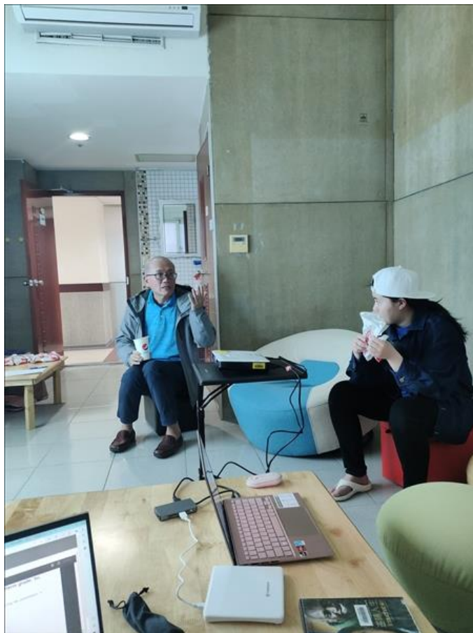
老師與同學們討論