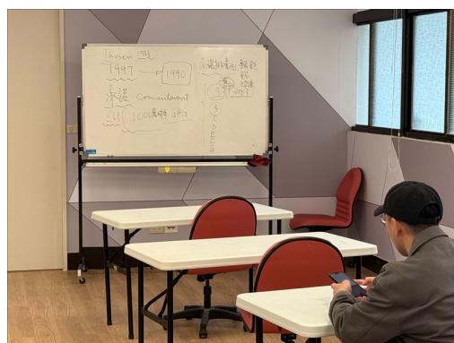
白板上以簡明圖示說明歐盟承諾與減碳計畫，便於理解。