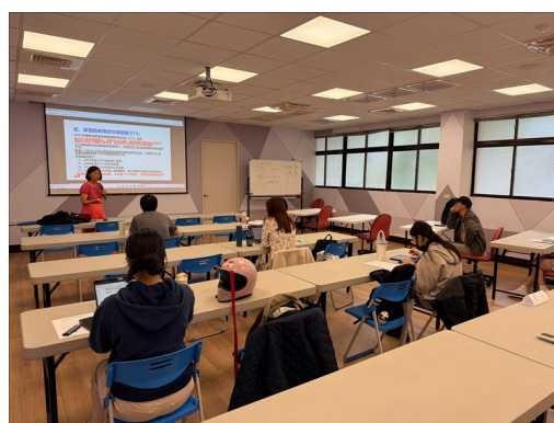
學員積極參與課程互動討論。