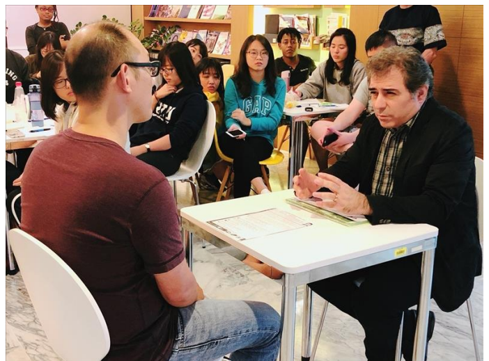
1 對 1 面試練習