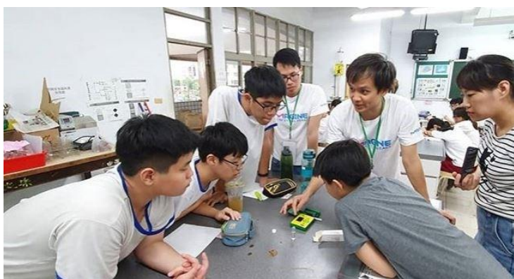
台灣默克的工程師們指導同學操作儀器進行實驗。

小港國中的這場活動，只有分析車到，因為今天的活動比較特別，來參加的都是科學社的同學，因為他們本來就對科學有興趣，再加上比較常做實驗，都有一些基礎的觀念，所以化學遊樂趣活動將要帶著他們從水質分析實驗的設計開始，了解水質分析標的物的選擇與實驗設計的方法，一直到親自動手用傳統實驗方式與現代儀器分析方式進行量測，最後還分組討論實驗的結果。台灣默克也特別派出最專業的工程師們來協助講解課程，讓這些對科學很有興趣的同學，近距離與專家們接觸，分享實驗的點點滴滴。