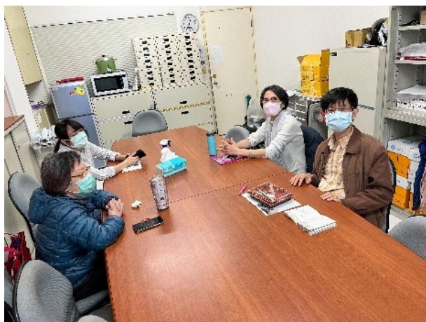
此為老師們討論問卷細則