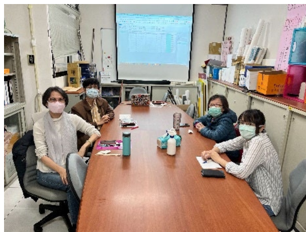
此照片為老師們的會後合影