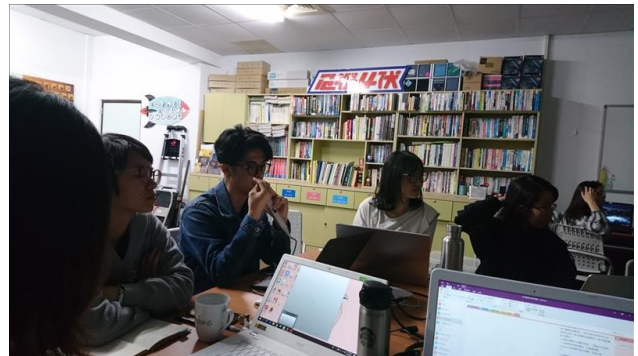
業師為課程進行講解