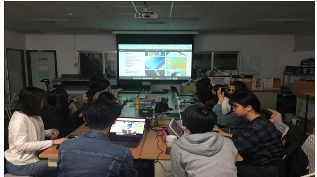
講師從事平面設計師工作， 鼓勵大家把作品放到 behance