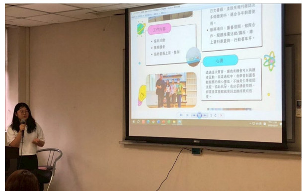
參與實習的學生們依續上臺分享介紹工作內容和實習成果