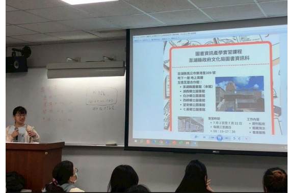
學弟妹專心聆聽學長姐分享實習成果