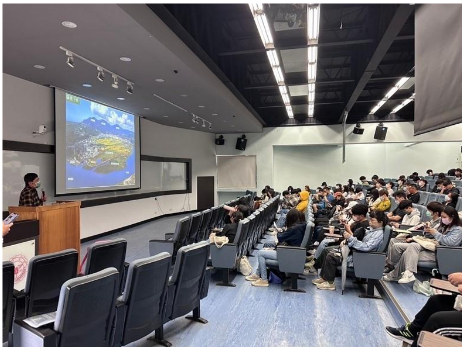
葉主任介紹關渡自然公園環境