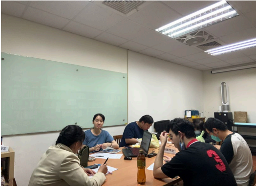
介紹本次課程總單元及相關內容