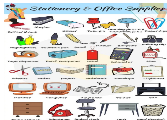
結合常用辦公室用品