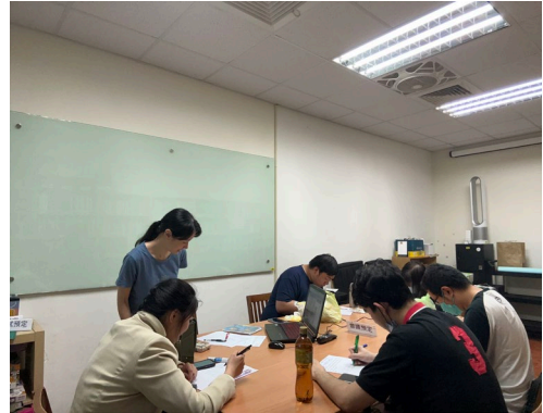
學員練習及討論課程內容