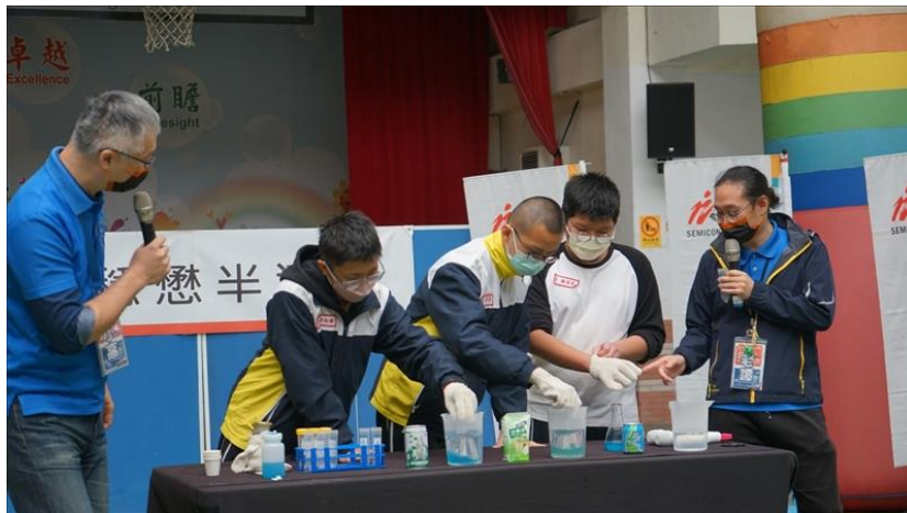
仔細做實驗的學生