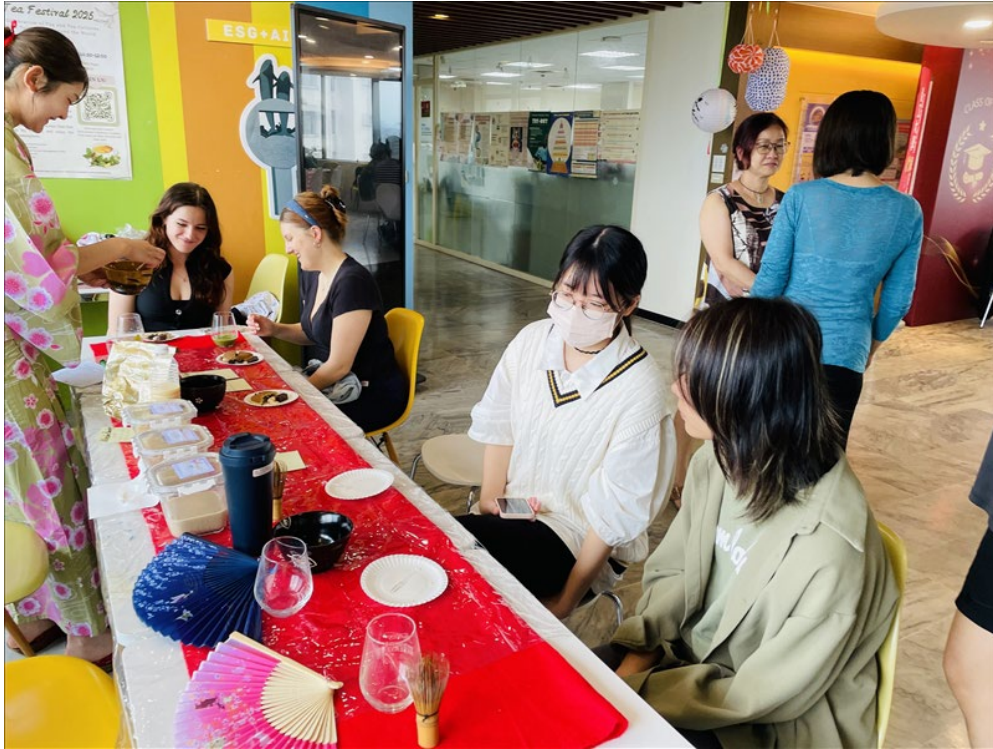
二位日本交換生與教設系台灣同學，共同創作抹茶 x 鐵觀音奶茶新風味，獲得熱烈回應