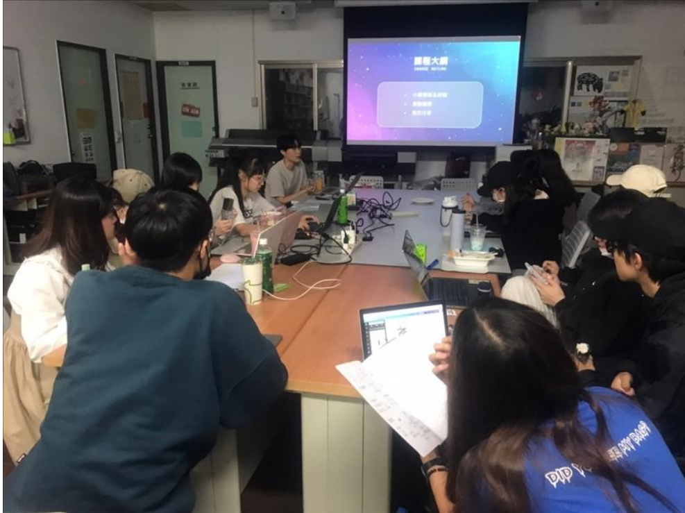
業師進行最後 QA 環節