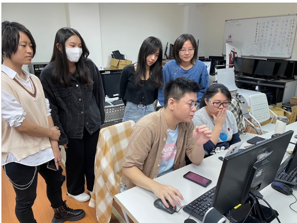
講師親自示範如何優化同學的作品