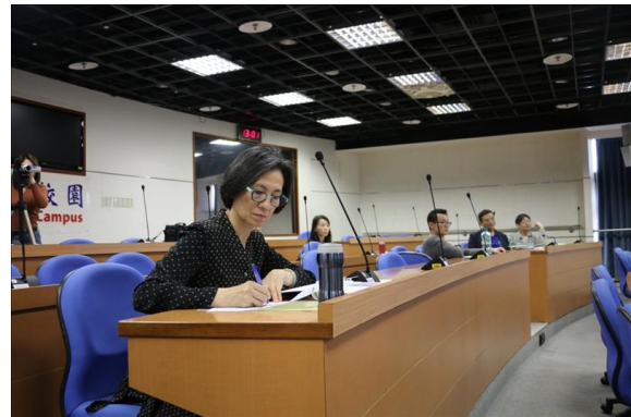
與會老師專心聽講