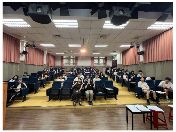
6. 講座結束與同學們的大合照