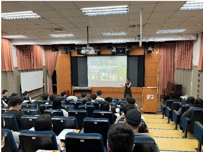
5. 林珣甄老師說明「人人劇場」的概念