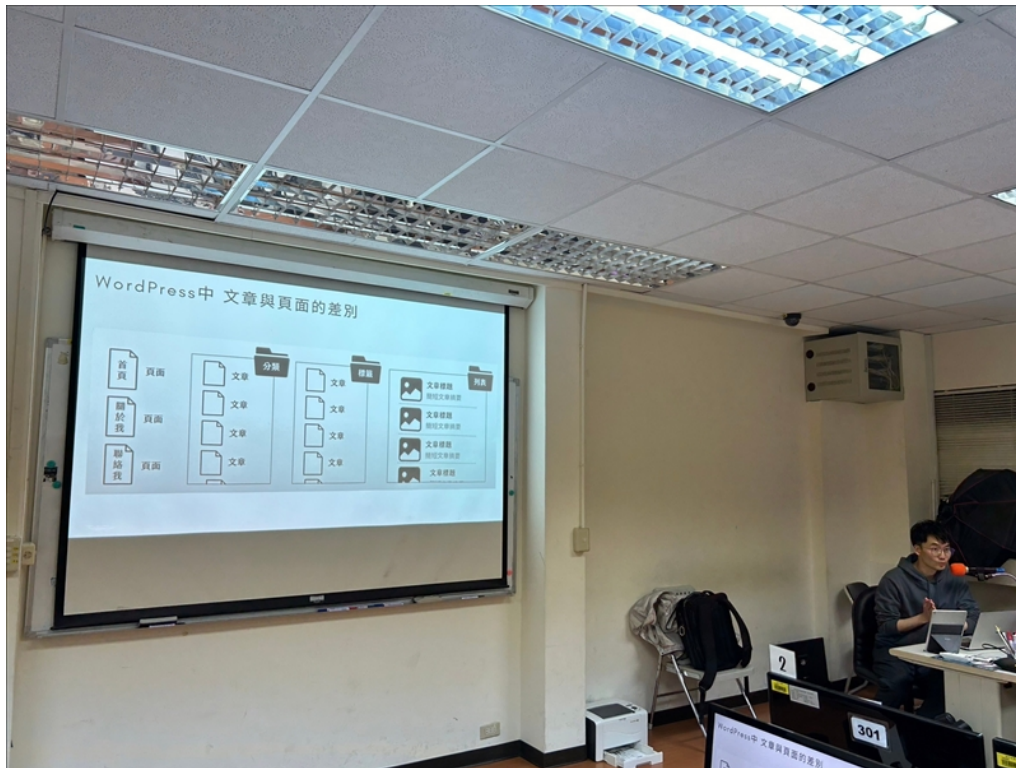
業師進行網站架構的說明