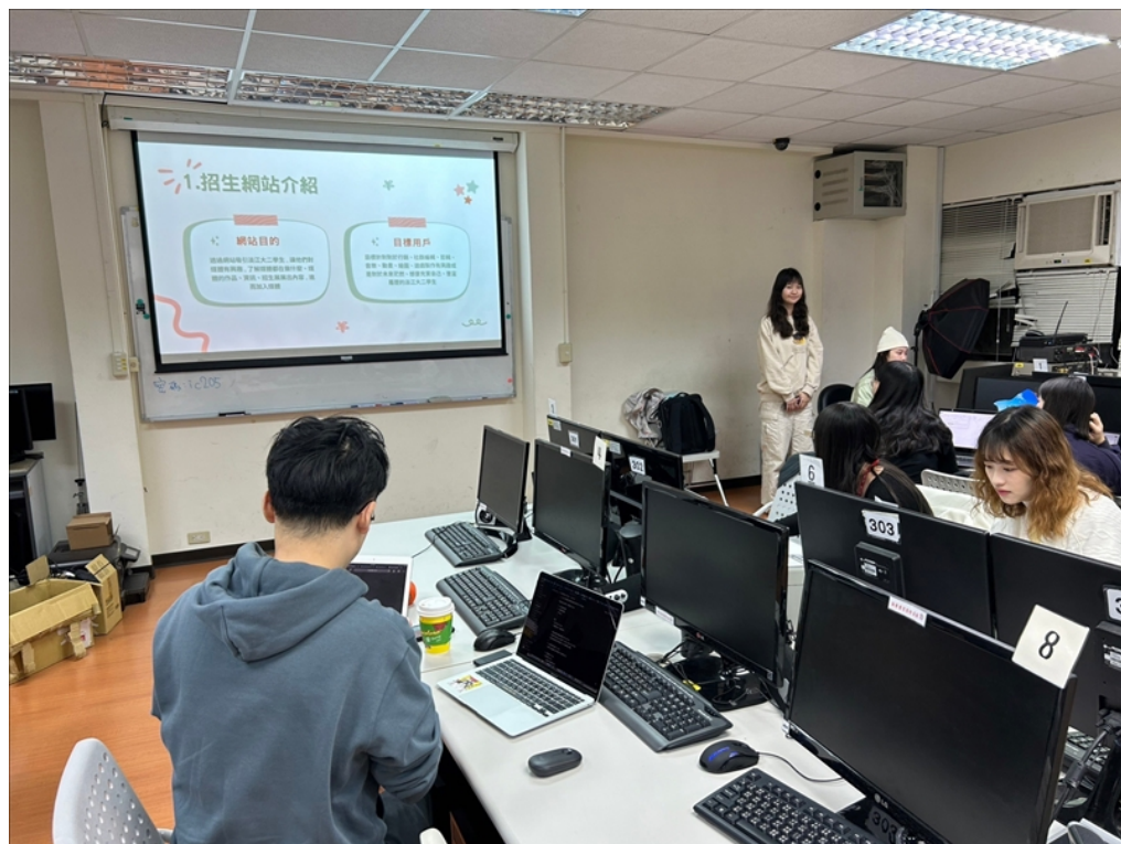
小組進行企劃發表