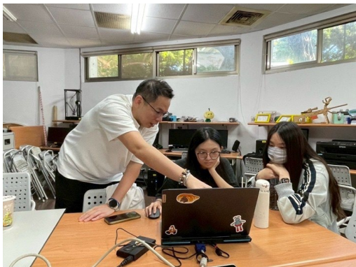
業師指導學生遊戲開發方向