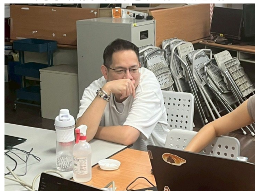
業師專心聆聽同學講解