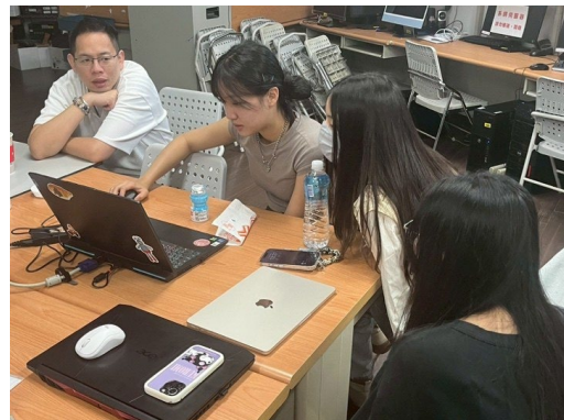
同學依據業師意見修改遊戲