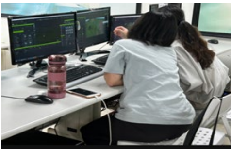
同學課中討論製作方式