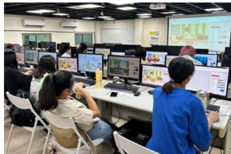
學生練習場景操作