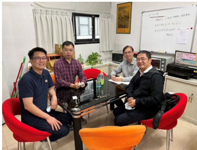
講者與老師討論交流

臺北水源特定區為大台北地區 630 萬人口主要自來水水源集水區，且 97.5%自來水水源水量取至集水區內新店溪，須提高新店溪流域及其上游的防災強韌性，以因應氣候變遷極端強降雨，確保自來水水源水量與水質之安全穩定。人工智慧程式 python 在集水區防災監測的應用，以臺北水源特定區為案例包含：(1)降雨、河川水位、流量等水文資料監測、(2)河川水質監測、(3)土石崩塌監測、及(4)演算、預測與輔助決策。結合人工智慧物聯網(AIoT)可連結得取任何感應器(sensor)監測資料，再經過人工智慧程式 python 演算得到預測結果，作為預警監測與決策參考。本次演講內容之應用對象雖以水資源組(水利署業務)為主，及少些環工組相關河川水質監測，但人工智慧物聯網(AIoT)與人工智慧程式 python 皆為專業上應用工具，鼓勵同學在校要自主跨領域學習。